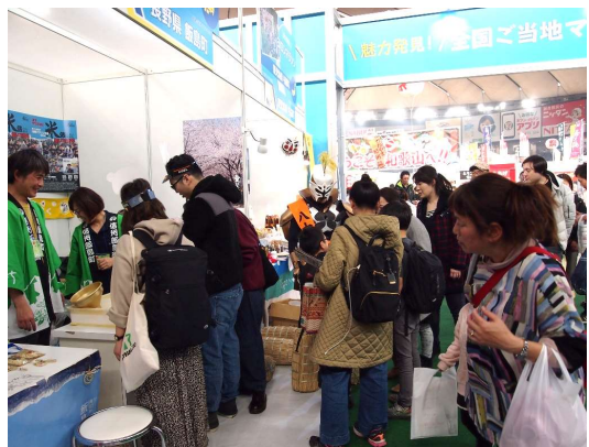
行列の米俵マラソンブース前

今回は観光協会事業としての参加。町をアピールする企画とし、お米のすくい取りを行い大人気でした。期間中の毎日、何回も来てくれるお馴染みさんも出来ました。